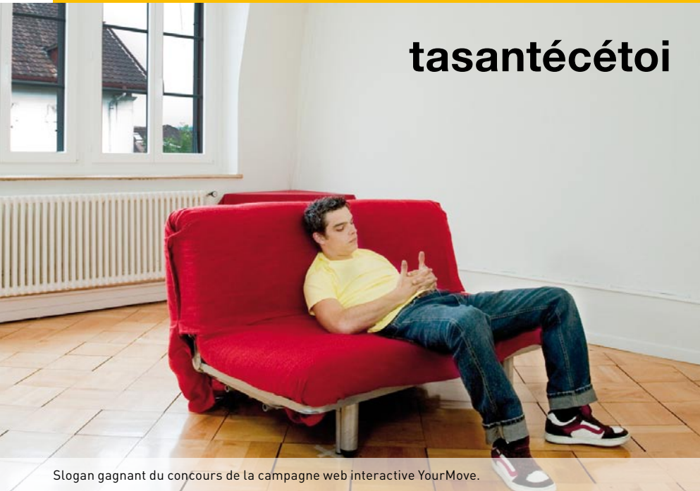
Slogan gagnant du concours de la campagne web interactive YourMove.